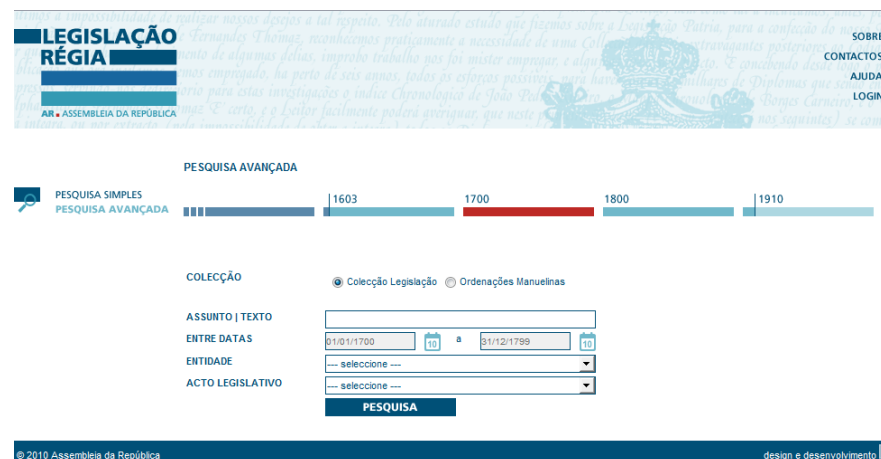
2 - Pesquisa avançada